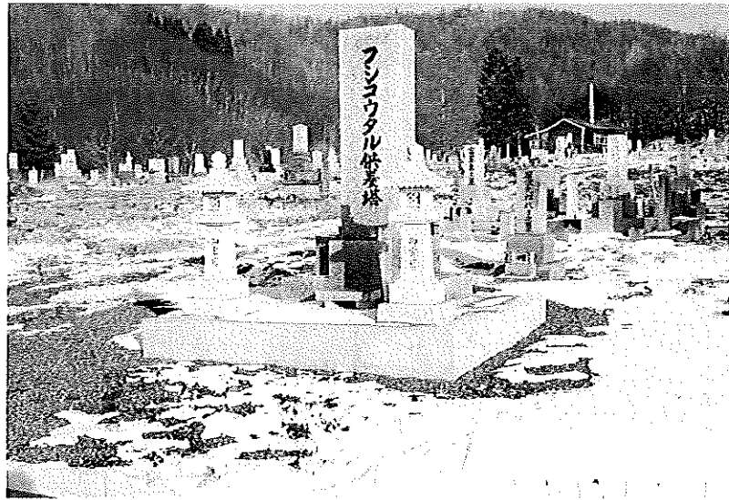
移転先の無縁供養塔 (杵臼共同墓地)