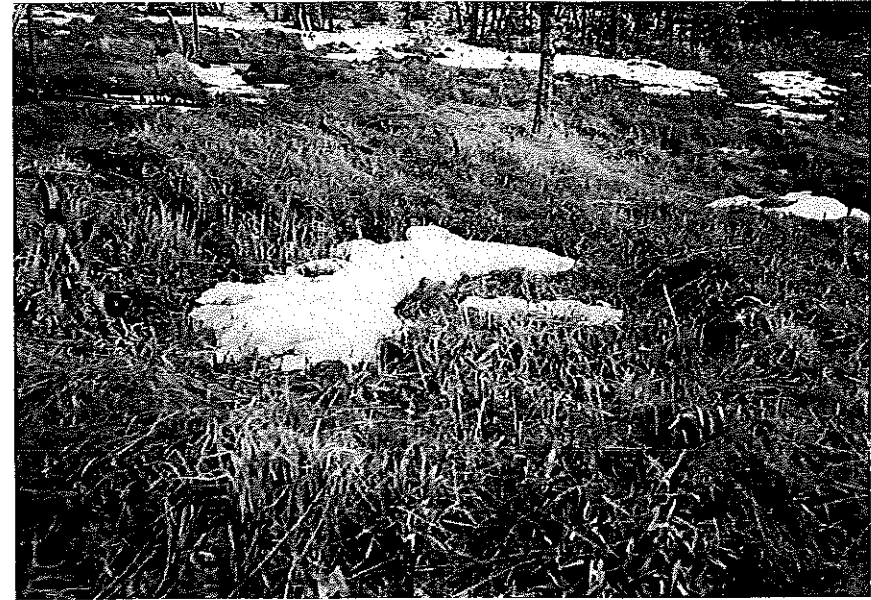
その2 (写真 中央部分に埋葬されている)