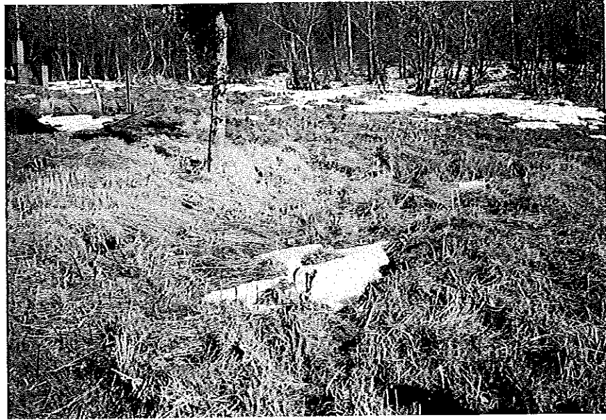
その3 (写真中央部分に埋葬されている)